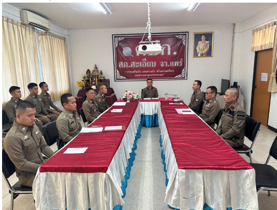
รูปถ่ายผลการดำเนินงานจริง ของสถานีตำรวจของท่าน